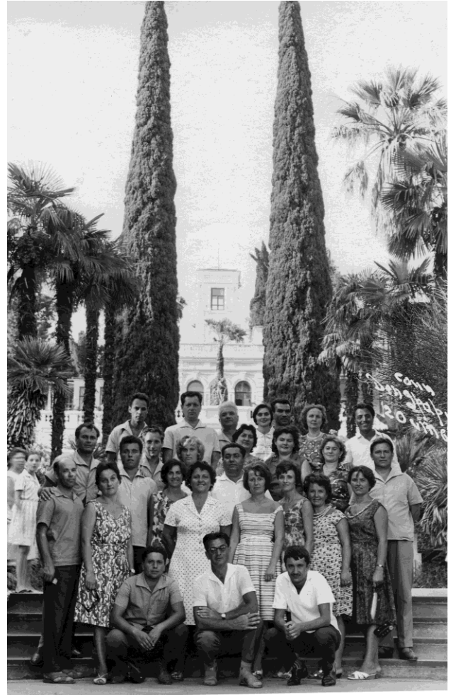
Rencontre scientifique à Soci, 11 août 1965 (archives Institut d'Archéologie « Vasile Pârvan » de Bucarest).