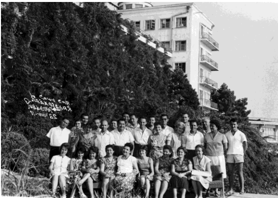
Rencontre scientifique à Soci, 11 août 1965 (Archives Institut d'Archéologie « Vasile Pârvan » de Bucarest).